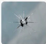
スター (放射状のヒビ)